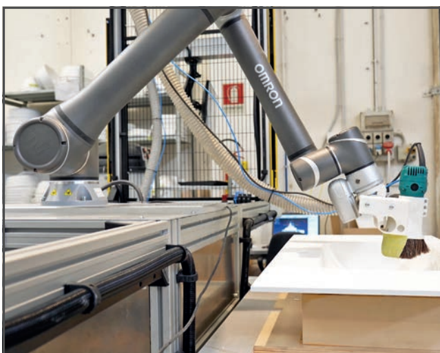
Der neue Cobot automatisiert die gesamte Endbearbeitung der aus Ocritech hergestellten Produkte von Topcustom.

Durch Einbeziehen des Cobots konnte Topcustom seine Produktion um 15 % steigern und stellt nun pro Woche 800 Waschbecken unterschiedlicher Modelle und Größen her. Von der Erstbestellung bis hin zur Auslieferung des fertigen Produkts lässt sich der gesamte Prozess in zwei Wochen durchführen. Dabei wäre das hohe Maß an Präzision und Wiederholbarkeit mit manueller Arbeit nicht zu erzielen. Dieser Schritt in die Welt der Industrie 4.0 hat Topcustom zudem die Möglichkeit gegeben, von der Einbindung künftiger Produktionsdaten zu profitieren: Dazu wird eine Verknüpfung zwischen den Produktcodes und den dazugehörigen Verarbeitungsprogrammen erstellt.