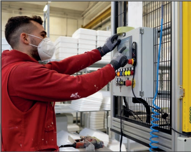
Durch Einbeziehen des Cobots konnte Topcustom seine Produktion um 15 % steigern.