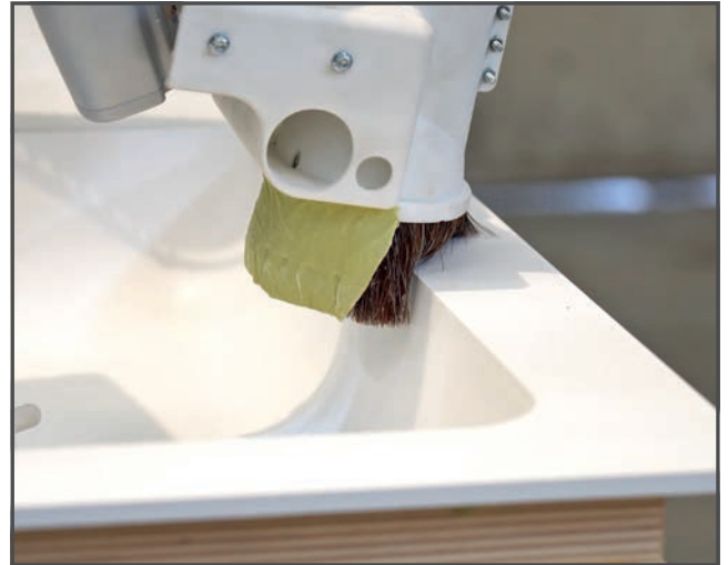
Von der Erstbestellung bis hin zur Auslieferung des fertigen Produkts lässt sich der gesamte Prozess in zwei Wochen durchführen.