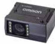
Tableau de comparaison des produits