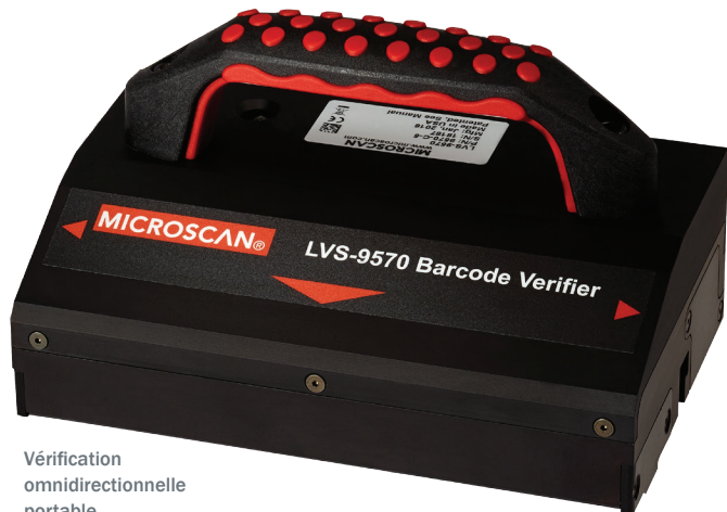
Vérification omnidirectionnelle portable