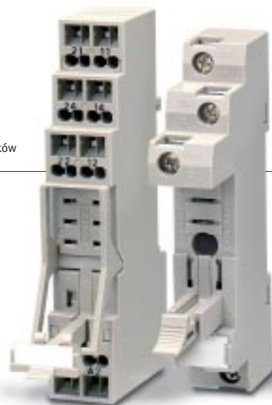
P2RF-E Gniazdo zacisków śrubowych