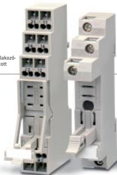
P2RF-E Csavaros érintkezőaljzat