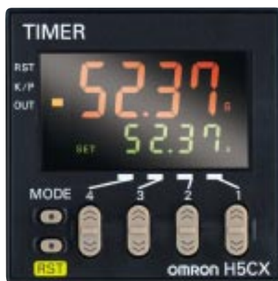
- Časovač - Dvojitý časovač